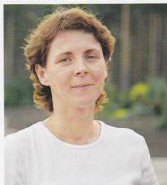
Anitai ir talants augus sagrupēt krašņās kompozīcijās.

Neparastu un eksotisku augu pasaulē ir ļoti daudz. Braukājot pa dažādām valstīm, izvēlos tos, kuri man patīk. Mājās stādu izmēģinājuma lauciņā, kuru draugi iesaukuši par zoodārzu. Tur tiek pārbaudīta auga piemērotība