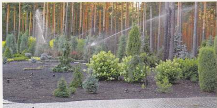
Labi izdevies paveikt arī šovasar visgrūtāko darbu – paglābt augus no slāpēm.

Neparastu un eksotisku augu pasaulē ir ļoti daudz. Braukājot pa dažādām valstīm, izvēlos tos, kuri man patīk. Mājās stādu izmēģinājuma lauciņā, kuru draugi iesaukuši par zoodārzu. Tur tiek pārbaudīta auga piemērotība